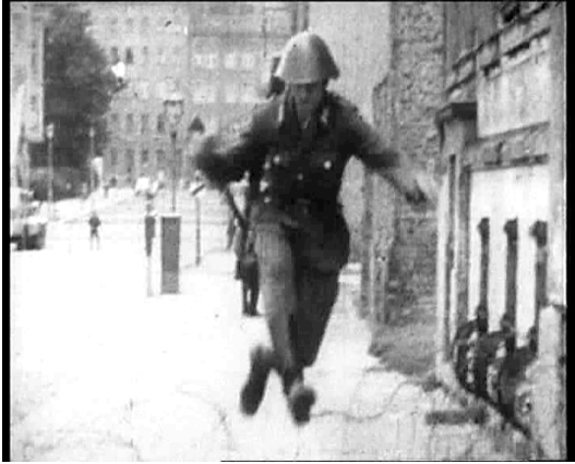
Fig. 6 Bernauer Straße, Conrad Schuman fuyant la RDA en 1961.