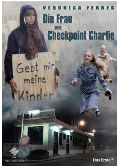
Fig. 2 Affiche de Die Frau vom Checkpoint Charlie ( La femme de Checkpoint Charlie , Annette Hess/Miguel Alexandre, 2007). Veronika Ferres dans le rôle d'une (super-)mère qui se bat pour récupérer ses enfants restés en RDA.

La concentration des Dokudramen sur les crises et sur l'appareil répressif est-allemand comme seul lieu de mémoire véhicule la thèse téléologique d'un « Untergang auf Raten » 12 , d'une chute à crédit. Toute la complexité du système de l'Allemagne socialiste et des interactions entre pouvoir et société pendant l'ère socialiste est ainsi gommée 13 . L'établissement de cette typologie — qui fait certainement tort à maints films — suggère l'existence de tendances et de choix thématiques, qui reflètent la perception dominante, dans les media allemands, de l'histoire contemporaine. Trois schémas de narration s'y dessinent : le récit d'un Troisième Reich marqué par une souffrance partagée par tous, celui d'une RDA en crise permanente, site — pour une partie des Allemands — de la poursuite des souffrances, et enfin la RFA envisagée comme une communauté solidaire qui serait miraculeusement parvenue à échapper à la souffrance et aurait finalement réussi à en arracher les « frères et sœurs à l'Est ». Ces films sont pour la plupart produits par des Allemands de l'Ouest et des sociétés de production ouest-allemandes (notamment Nico Hofmann pour teamWorx,