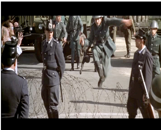
Fig. 7 Le Tunnel ( Der Tunnel , Roland S. Richter, 2001), mise en scène devant la porte de Brandebourg d'un soldat traversant vers l'Ouest.