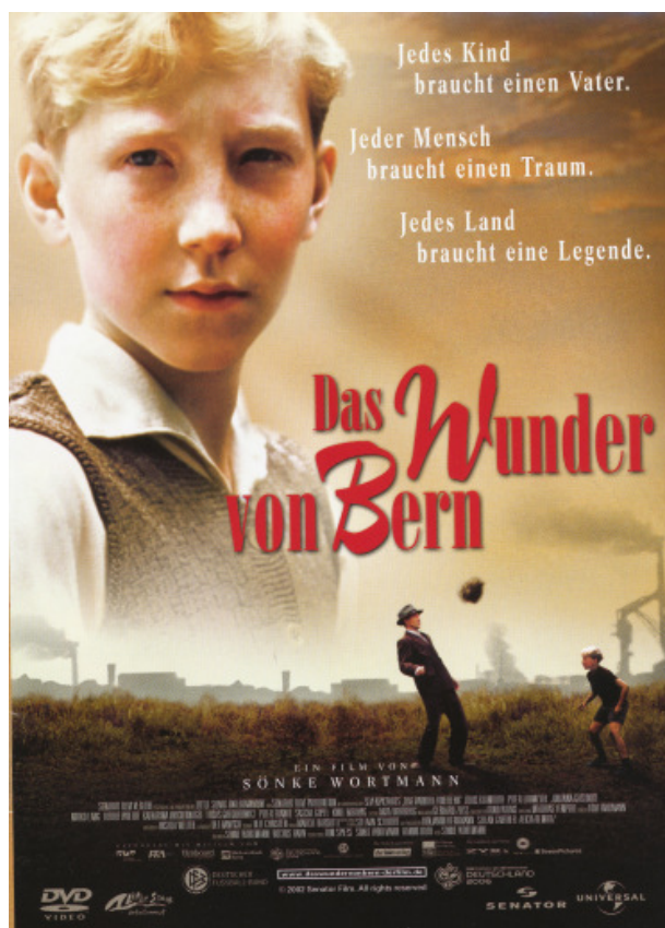
Fig. 1 Affiche de Das Wunder von Bern ( Le Miracle de Berne , Sönke Wortmann, 2003). L'affiche propose une vision mythologique de l'histoire en proclamant : « Chaque enfant a besoin d'un père. Chaque homme a besoin d'un rêve. Chaque peuple a besoin d'une légende ».

titre emblématique Le Miracle de Berne ( Das Wunder von Bern , Sönke Wortmann, 2003, 113 min), dédié à la victoire de la RFA lors de la coupe du monde de football de 1954. Les dangers sont vus comme provenant de l'extérieur, ainsi dans le film consacré au blocus de Berlin par l'URSS en 1948 et à la mise en place d'un pont aérien : Airlift: seul le ciel était libre ( Die Luftbrücke. Nur der Himmel war frei , Dror Zahavi, 2005, 186 min). Alternativement, la menace est attribuée aux forces de la nature, qu'il s'agisse du raz-de-marée ayant dévasté Hambourg en 1962 ( Die Nacht der großen Flut , « La nuit du grand déluge » 11 , Raymond Ley, 2005, 150 min) ou de l'accident minier de Lengede ( Le Miracle de Lengede , Das Wunder von Lengede , Kaspar Heidelbach, 2003, 182 min), auxquels survécurent miraculeusement les mineurs bloqués au fond de la mine.