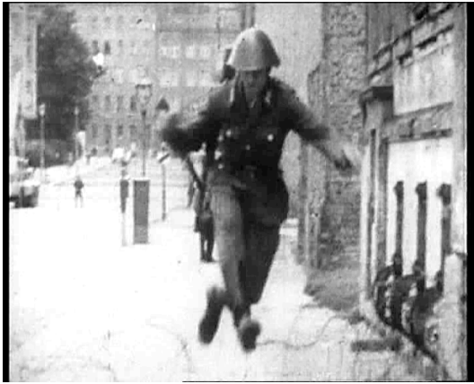
Fig. 6 Bernauer Straße, Conrad Schuman fuyant la RDA en 1961.