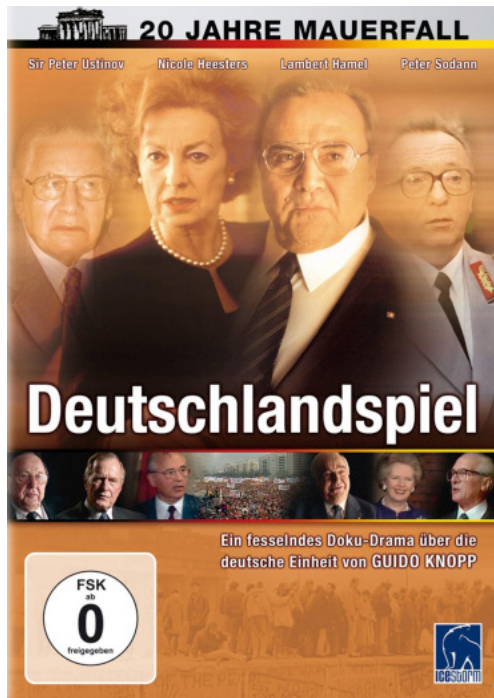
Fig. 3 Jaquette du DVD de Deutschlandspiel ( Les Heures historiques , Hans-C. Blumenberg, 2000), dans lequel des acteurs historiques, visibles dans des images d'archives, sont joués par des acteurs de renommée.

l'ex-RDA en « paysages en fleurs » 17 , sans que soient mentionnés dans l'entretien avec l'ancien chancelier allemand, dix ans plus tard, l'écart entre cette promesse et la réalité de l'unification, ainsi que la déception de nombreux Allemands de l'Est. Ce faisant, Helmut Kohl poursuit une œuvre hagiographique. Débats et controverses sont absents de ces Dokudramen où les réalisateurs font comme si l'histoire ressemblait au récit linéaire offert à l'écran.