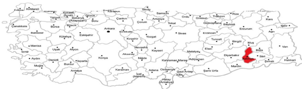
Figure 1: Les provinces de Turquie : En rouge, la province de Batman, où se situe notre terrain de recherche.

Les élèves qui manifestent un intérêt pour l'apprentissage du kurde se concentrent en majorité dans les provinces du sud-est de la Turquie où la population kurde est majoritaire. Ceci explique que le choix du terrain de cette étude se soit porté sur ces provinces. Nous avons fait le choix d'effectuer notre enquête dans deux contextes : urbain et rural. C'est la ville de Batman qui a été retenue pour l'enquête en milieu urbain. Pour ce qui est du contexte rural, le choix s'est porté sur un village 4 à une heure de distance de Batman. La zone en rouge sur la carte géographique ci-dessous indique la localisation de notre recherche de terrain :