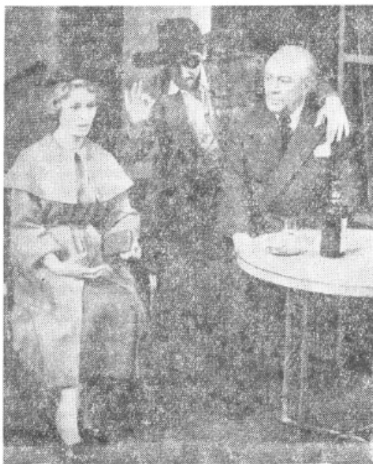
Сцена из комада „Дрвче умире усправно“