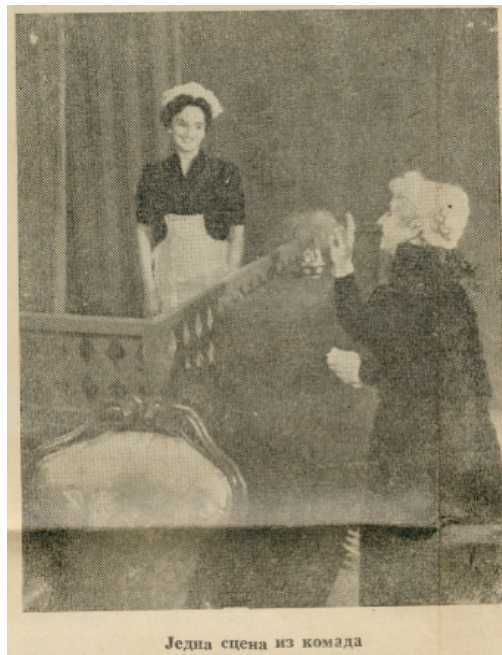
Foto de la representación sacada del periódico Vesti (05/03/1959) Archivo del Museo del Teatro (Muzej pozorišne umetnosti Srbije, Belgrado)

- Teatro Nacional de Užice, 19/02/1959, dirección: Dušan Stanojević; escenografía: Branko Kovačević; trajes: Dobrinka Drndarević; carpintero: Ratko Nikolić.