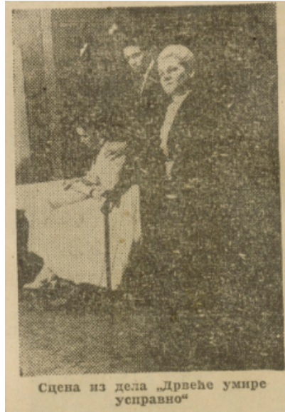
Foto de la representación sacada del periódico Dnevnik (18/03/1958)