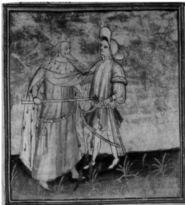
Fig. 2 : PARIS, B.N.F., ms. fr. 97, f° 541, Roman de Tristan , XV e siècle.

Accorder à la blessure de Tristan un caractère sexuel, c'est faire peser l'ombre du péché sur les amants et associer la sexualité, la faute et la mort en faisant de la blessure de Tristan un châtement approprié, mais c'est surtout « revendiquer l'égalité de Tristan et des héros du Graal, [...] donner au coup qui frappe Tristan la même résonance qu'au coup porté par Balain, le héros maudit 15 ». Tristan, victime du même coup que le roi Pêcheur devient un héritier du gardien du Graal. Le coup dont il est victime devient alors, lui aussi, fatal, noble et mémorable.