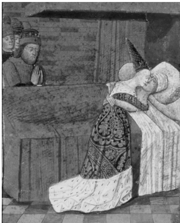
Fig. 7 : PARIS, B.N.F., ms. fr. 112, Lancelot en prose , f° 145.

étant la Grande Pietà ronde du Louvre, datée des environs de 1400 et exécutée pour Philippe le Hardi. La transition visuelle entre le texte et notre enluminure se fait sur cette même couleur rouge : la tunique d'un rouge désaturé de Marc est placée juste au-dessus de la lettrine de la même couleur. Le sang de Tristan va vers la lettre, il chevauche le pied de Marc pour aller emplir la lettre. La lettrine semble avoir recueilli le sang du héros comme un nouveau Graal.