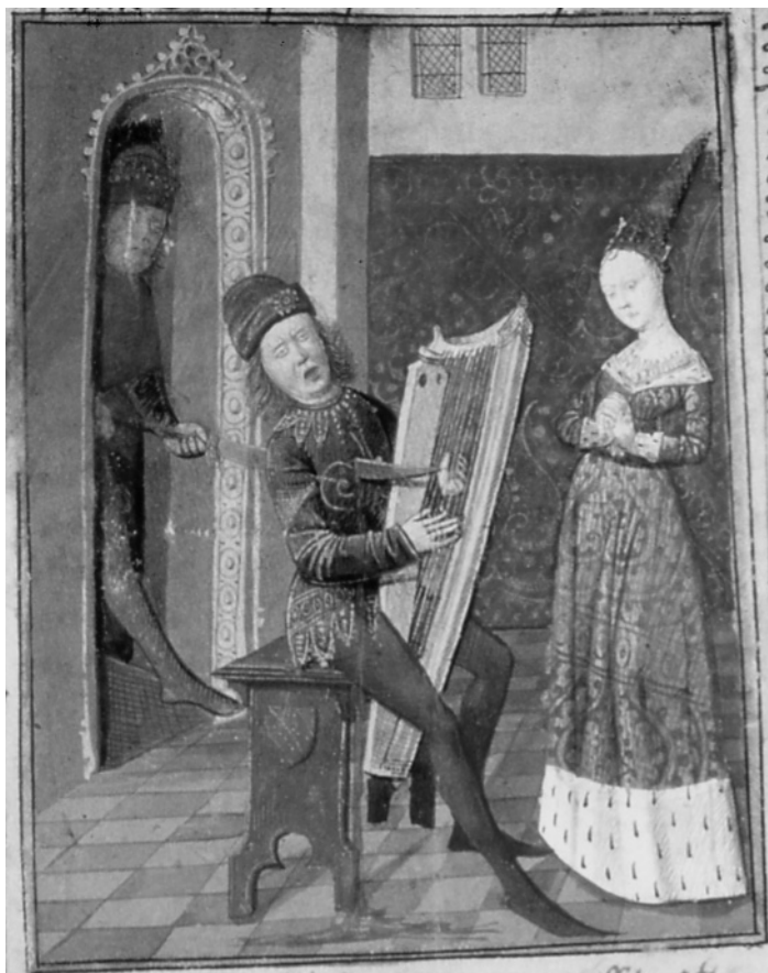
Fig. 3 : PARIS, B.N.F., ms. fr. 112, quatrième et dernier livre, f o 144, Lancelot en prose , 1470.

la couleur rouge de la tapisserie qui recouvre le mur. Sur ce fond aux couleurs chaudes se détachent Iseut et la harpe de Tristan : c'est là l'espace de la femme, de la musique et de l'amour. Dans la moitié gauche de l'image, on voit le roi, armé d'un fauchard 17 , attaquer traîtreusement Tristan. À la moitié gauche de l'image (au fond d'une couleur plus claire, dans les ocres beiges) appartiennent donc la silhouette du roi, l'arme offensive, et la tête rejetée en arrière de Tristan, au visage convulsé : il a le visage déformé, les sourcils froncés, la bouche entrouverte et les commissures des lèvres tombantes, la