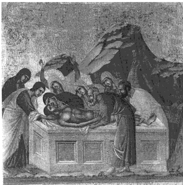
Fig. 6 : SIENNE, Musée de l'Œuvre du Dôme, DUCCIO DI BUONINSEGNA, Histoires de la Passion du Christ (verso de la Maestà) , fin XIII e .

C'est un motif iconographique intéressant émotionnellement, « dont l'origine remonte au Trecento italien 44 » :