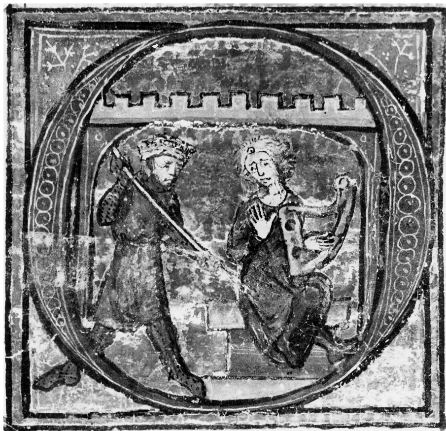
Fig. 1 : VIENNE, Österreichische Nationalbibliothek, ms. 2542, f° 487 v°, Roman de Tristan , ca 1300.

inscrits de façon homogène. On remarque toutefois que Marc, qui lève le bras pour frapper Tristan de sa lance, a le pied qui sort de l'espace délimité par l'initiale ; il a la jambe recouverte par la barre du « O ». C'est là la marque d'une transgression, la monstration par l'enlumineur du roi comme personnage négatif ; il ne s'agit pas d'une contrainte spatiale car l'écartement des jambes du roi est amplifié en vue de cet effet. Cette exagération permet aussi de figurer le roi comme personnage en action et de renforcer la brutalité de son intervention. Tristan au contraire prend appui du pied droit sur le rebord de la lettrine, il s'inscrit dans la logique figurative de l'image. L'opposition entre les deux personnages est davantage travaillée encore : l'un est debout et l'autre assis, l'un figuré en guerrier et l'autre en musicien-poète. La ligne descendante formée par la lance du roi et la ligne ascendante dessinée par la harpe contribuent à conférer à l'image son mouvement, son rythme, et à