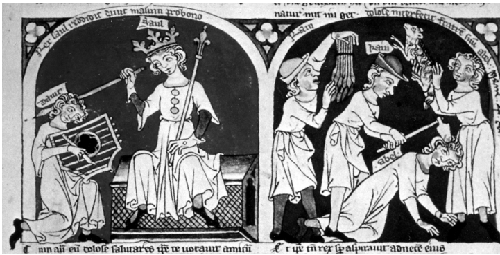
Fig. 5 : KREMSMÜNSTER, Stiftsbibliothek, ms. 243, f o 24, Speculum Humanae Salvationis , première moitié du XIV e s.

les auteurs et illustrateurs du Moyen Âge n'hésitaient pas à rendre mortel le coup porté par Saül pour les besoins de la comparaison. L'image met en effet en rapport deux scènes de l'Ancien Testament : le coup porté à David par Saül et celui de Caïn à Abel. Caïn tue son frère, et pour justifier le rapprochement voulu par l'auteur, l'enlumineur rend mortel le coup porté par Saül, sa lance traverse la tête ensanglantée de David. L'utilisation de cet épisode par un auteur médiéval nous prouve que la volonté de tuer vaut le meurtre dans les mentalités du Moyen Âge.