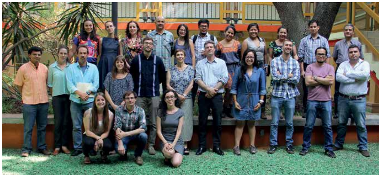
Los participantes en las jornadas en Zamora, Michoacán, México.