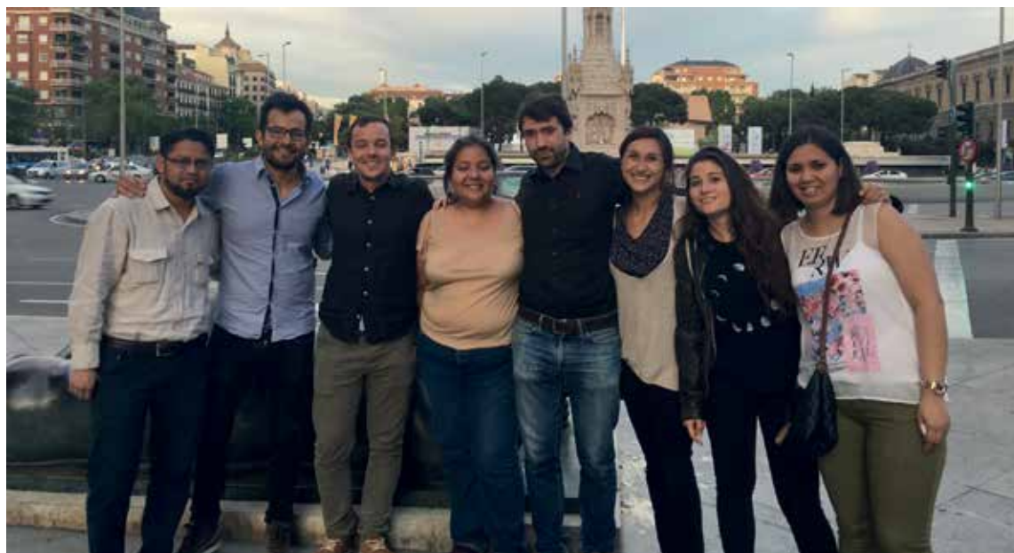
Los participantes en las jornadas desde la Casa de Velázquez, Madrid, España.