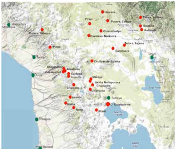
Figura 3. Distribución de principales sitios con edificios Chullpas, norte de Chile, sur Perú y altiplano de Bolivia. ● Chullpas ● Ciudades actuales. Fuentes: Muñoz y Chacama 2006; E. Duffait com. pers. 2009.

El espacio fue dividido por los españoles y en el territorio nuclear de Carangas los pueblos posteriores a las reducciones no se encontraban en las inmediaciones de los antiguos pueblos prehispánicos. Por otro lado, las chullpas mayores estaban fuera de los centros poblacionales; mientras que en la vertiente occidental de los Andes las tumbas se hallaban en las cercanías de los pueblos prehispánicos (Figura 3).