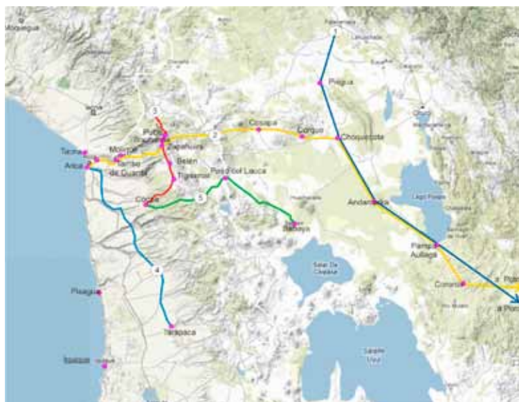
Figura 4. Rutas principales, mapa esquemático.