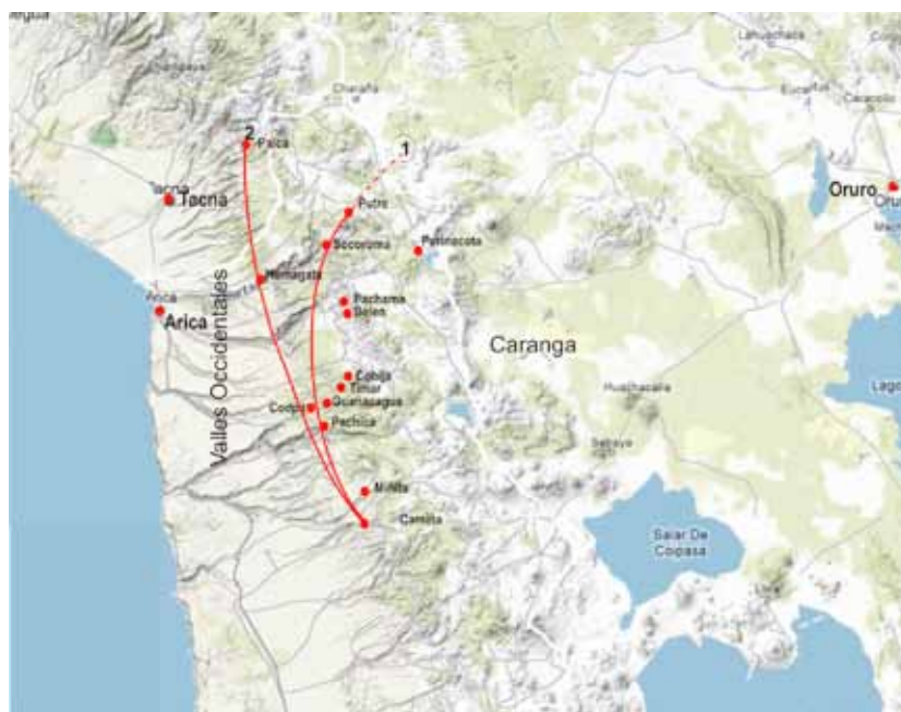
Figura 2. Deslindes Carangas en la documentación colonial (mapa esquemático).

a partir del Cerro de Coipasa, que sirve de límite entre las provincias de Lipez, Arica, Carangas y Paria, de aquí el amojonamiento continuaba sucesivamente con rumbo S.O. por Cerro Colorado, Apacheta de Tilluyaya, Abra de Ojo, cuchillada que divide las aguas (las unas a los altos del obispado de Arequipa y las otras a la del arzobispado (supuestamente el arzobispado de la Plata), Lupichiju, Pulquiza, Tres Cerillos, Sillillica, en el camino de Pica a Savaya, Cerro Colorado, cerca de Huasco de Lipez Huatacondo, quebrada de Chuquilla, donde cruza el camino de Guatacondo a Santiago de Chuquilla (Blanco 1904:XLII).