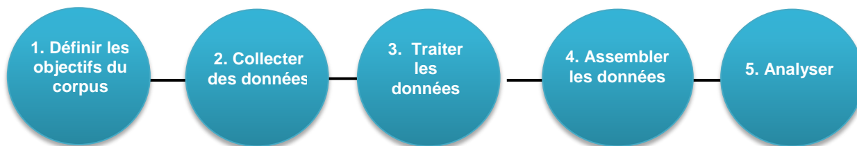
Illustration 1 : Les 5 étapes de la constitution d'un corpus de données orales

Les 5 étapes constituant la chaîne de production 6 d'un corpus peuvent être représentées sous la forme d'un schéma.