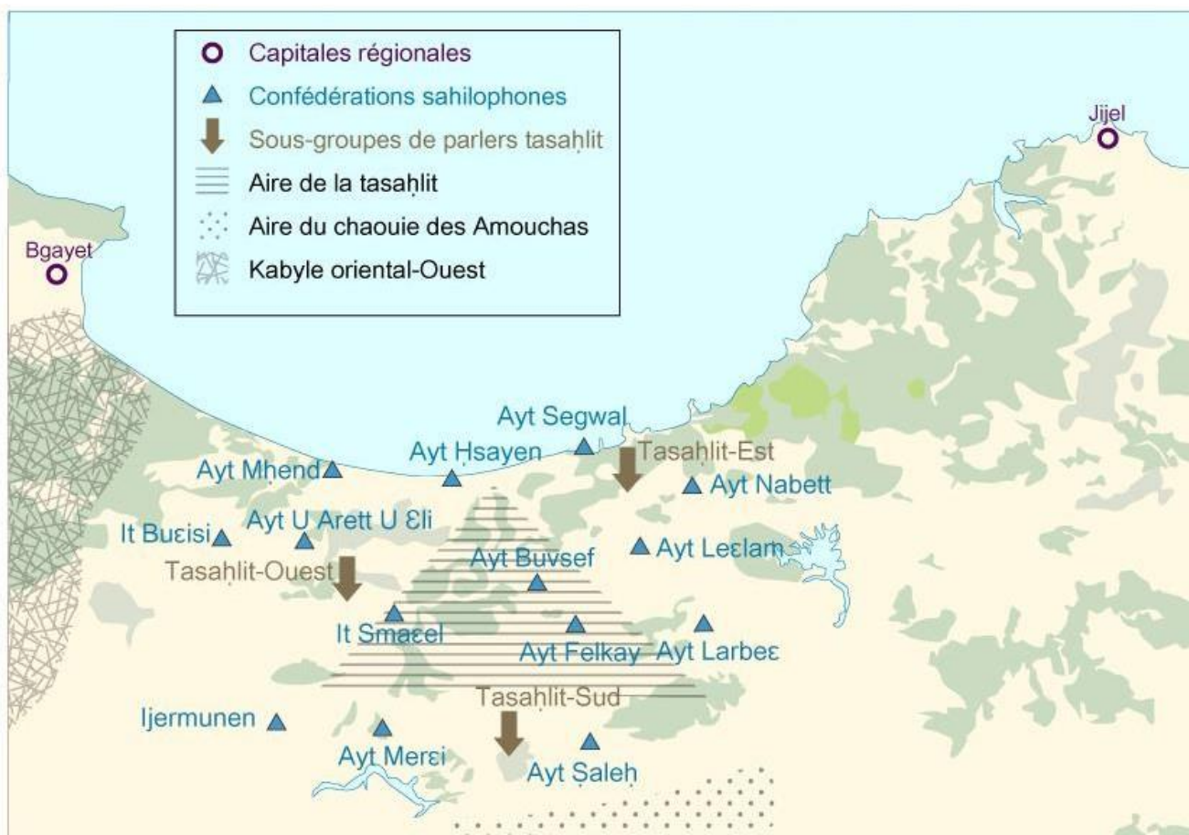
Carte 3 : L'aire tashlhitophone

ainsi que de variétés fortement marquées par le contact intra-berbère ou d'autres types de contact 35 , ou encore celle de parlers présentant des substrats / adstrats linguistiques extra-berbères 36 .