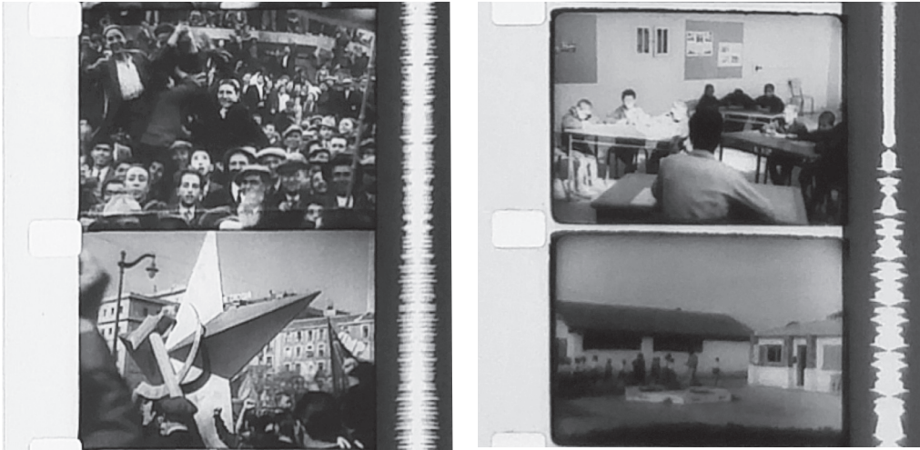
« Images de l'Histoire » : De Marx à la révolution mondiale et Algérie 1954, la révolte d'un colonisé.

développement, car elle pensait toujours à Propaganda : ce qui nous différençait, car j'ai toujours trouvé qu'il y a certes une propagande, mais également, par en bas, une autre vision des choses. Donc je déplaçais un peu les pôles de discussion.