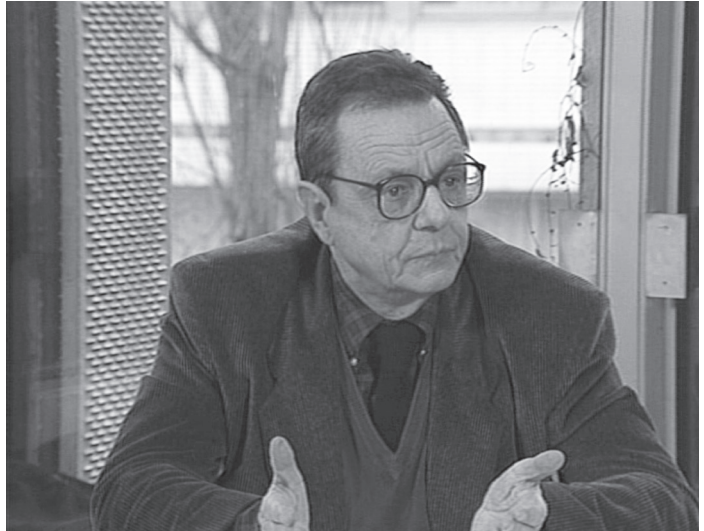
François Furet (coll. « Savoir et mémoire »).

à Polytechnique avec lui, il pouvait parler de tout en improvisant. Il fallait parler de la philosophie grecque ? Non, finalement c'était la philosophie au XVI e ? Bon, il commençait dans les trente secondes. On lui aurait demandé de parler du capitalisme rhénan, il en aurait parlé comme de n'importe quoi ! Il était un esprit, c'était net, clair, lumineux. C'était l'École des Annales en plus. Donc Morazé, je lui demande un film. Il le fait : première partie, très bien. Deuxième partie : il s'embarque dans des discussions théoriques sur le chiffre et la morale, sur la morale et la pensée, sur la pensée... C'était incroyable ! Ça a duré quatre heures. On a dû couper, mais la première partie était très bonne. Et Morazé est le seul, à l'EHESS, qui a eu la gentillesse de reconnaître que ce que je fais pour les gens de l'École, personne n'y avait pensé et que c'est très bien.