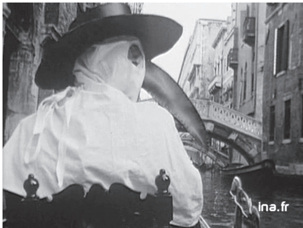
Une histoire de la médecine : le médecin-bec à Venise (épisode 1).