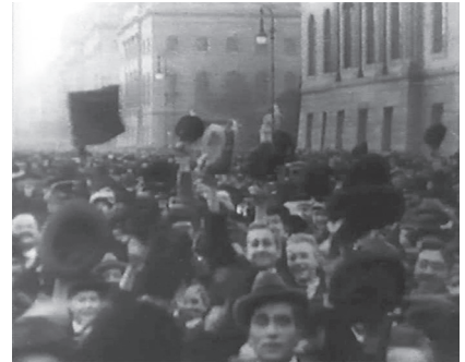
Liesse berlinoise à la signature de l'Armistice ( La Grande Guerre ).