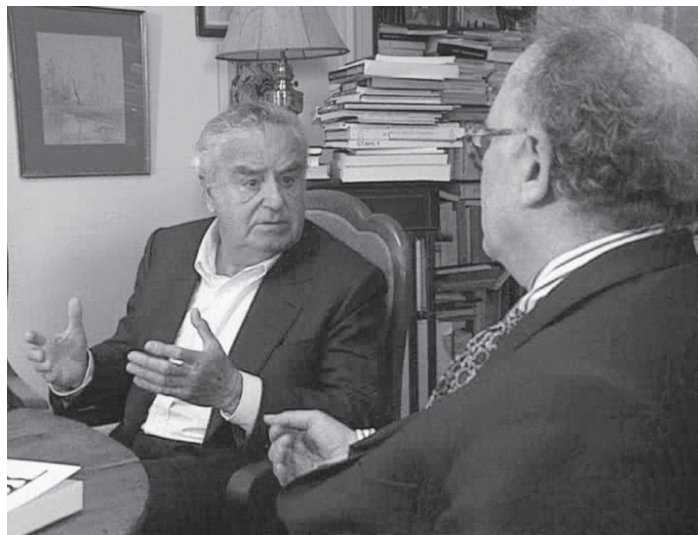
Jean-Pierre Vernant, interrogé par Pierre Vidal-Naquet. (coll. « Savoir et mémoire »).