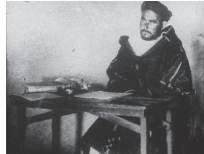
Abd el-Krim dans Histoire contemporaine : Révolution et guerre d'Espagne.