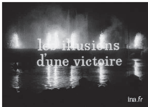
L'Année 1918 : titres des deux opus.

J-PB-M : Parallèlement, tu intègres l'École Pratique des Hautes Études en 1962. Tu entres aux Annales et à l'École pratique en même temps ?