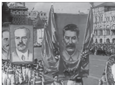
Esquisses du xx e siècle.

d'accord pour dire que le film de montage est toujours une falsification, parce qu'il implique un choix, or c'est ce que je voulais éviter. Dans mon livre L'Aveuglement. Une autre histoire de notre monde 30 , j'aborde ce problème pour montrer que c'est artificiel, en disant que dans un film de montage on prend du fil et on coud des documents. Tandis que si l'on montre deux documents sans les commenter, l'un à côté de l'autre, ça peut être une création historique valable. Exemple : j'avais trouvé des plans du départ joyeux des soldats en 1914, en gare de l'Est, image très connue, et le même départ des soldats français, dans la même gare mais en 1939, où ils font la gueule, chialent, où leurs bonnes femmes les poussent. On voit bien que ces deux images rendent compte de toute l'histoire. De même, Pierre Sorlin a trouvé deux plans de 1956 à Budapest où l'on voit les mêmes personnes manifestant avant et après la répression. Elles n'ont plus la même tête et on voit très bien ce qui s'est passé. Là, ni falsification ni montage. Ce n'est plus de l'histoire événementielle : c'est analysé par une création de l'image, pure. Ce sont ces réflexions que je me suis faites autour des films d'une minute.