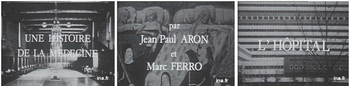
Une histoire de la médecine : générique de l'épisode 3.