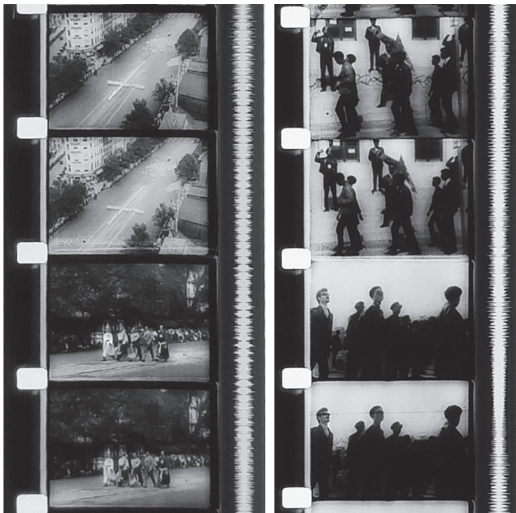
Du Ku Klux Klan aux Panthères noires.