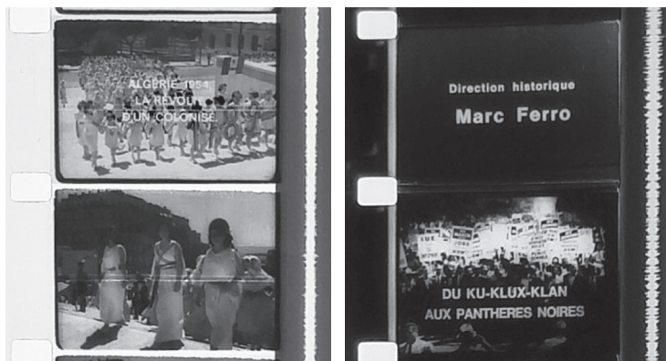
Deux titres de la collection « Images de l'Histoire ».

m'avait demandé d'établir une liste. Je lui avais dit : un, deux ou trois films sur la Grande Guerre ; j'en ai fait un ; un ou deux sur l'entre-deux-guerres, c'était L'Allemagne nazie . Et cette première série aurait pu être suivie d'une seconde. J'ai avancé qu'on pourrait faire quelque chose sur le « problème noir 23 » aux États-Unis. « Ah oui, le problème noir. Bonne idée ! »