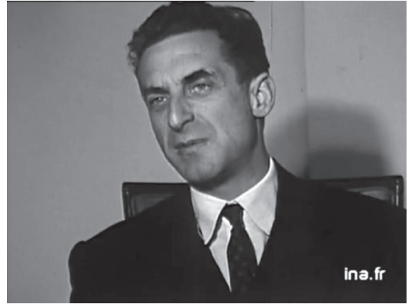
Indochine 45-46 : Hô Chi Minh (de dos) et témoignage de Jean Lacouture.