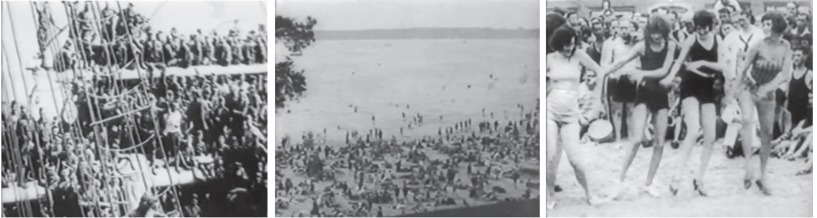
Une minute d'Histoire.

J-PB-M : As-tu intégré cette pratique dans les critiques filmiques que tu as faites ensuite ?