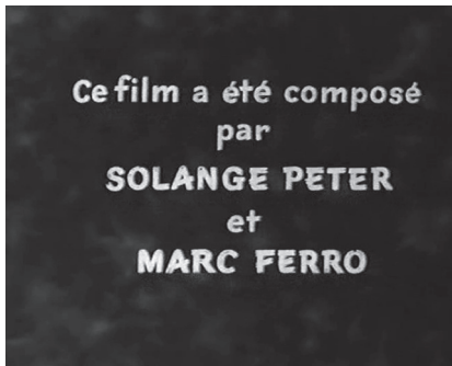
Générique de fin de La Grande Guerre .