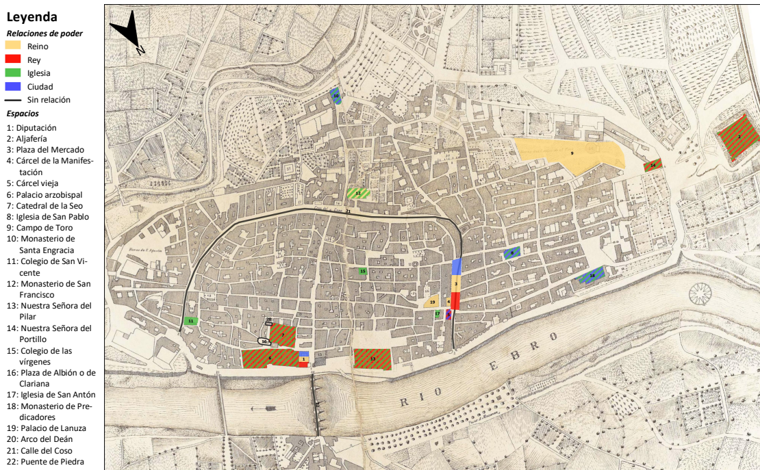
Figura 1. Representación de Zaragoza según Gonzalo de Céspedes y Meneses y Lupericio Leonardo de Argensola

Elaborado a partir de Plano y Vista de la Ciudad de Zaragoza por el Septentrión . Carlos Casanova / Juan Mora Insa, AHPZ, MF_MORAIND/0579.